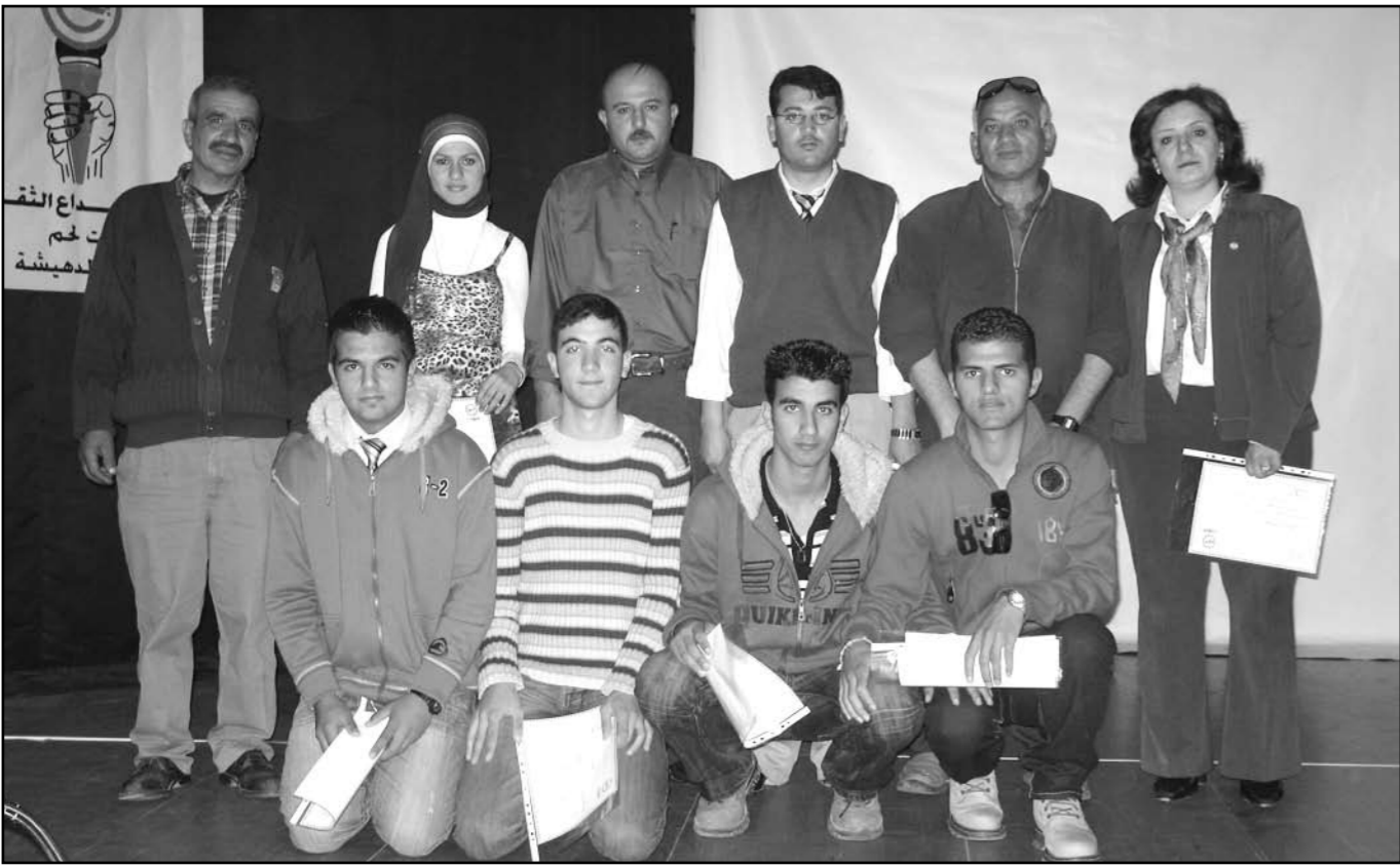
الخريجون بعد تسلمهم شهاداتهم

بيت لحم- عدنان الصراوي- نظمت رابطة الصحفيين الرياضيين مساء اول امس الخميس الدورة محمود خليفة احتفالاً بمناسبة اختتام دورة محمد ابو تريكة للاعلام الرياضي التي نظمتها الرابطة بالتعاون مع الاتحاد العربي للصحافة الرياضية والتي جرت في بيت لحم خلال الشهرين الماضيين. وحضر الحفل وكيل وزارة الشباب والرياضة موسى ابو زيد وعضو المجلس التشريعي محمد خليل اللحام ورئيس رابطة الصحفيين تيسير جابر وعضاء الرابطة عمر الجعفري واحمد البخاري وفايز نصار ومدير الغول والحاضر محمود السقا وجورج غطاس القائم باعمال رئيس اتحاد كرة القدم وخليل شوان مدير مديرية بيت لحم وعضوا تجمع قدسنا للاتحادات الرياضية